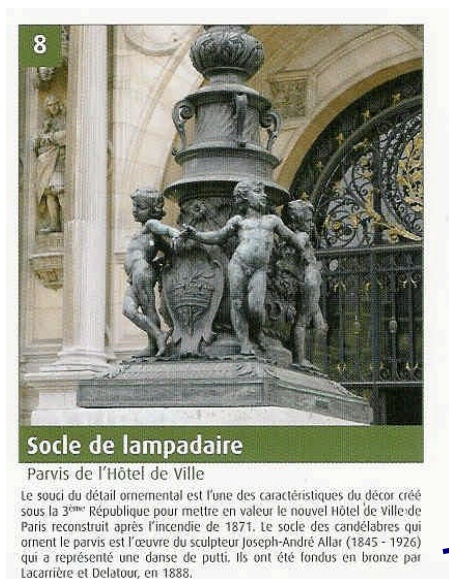
Socle de lampadaire